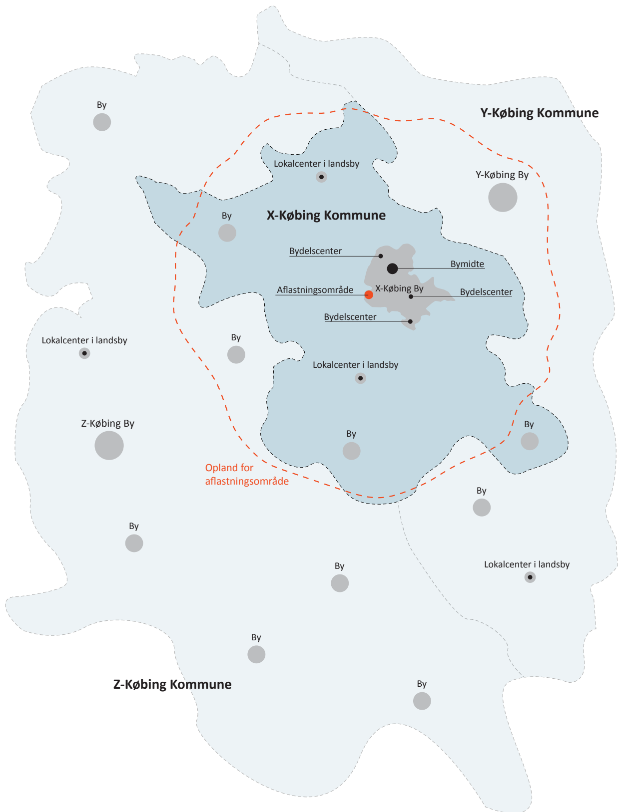
Eksempel på et aflastningsområdes geografiske opland markeret med rødt.